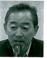
宮川米山奨学会委員長