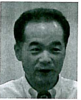
高木会員選考委員長