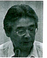
北村特別奨学金制度委員長