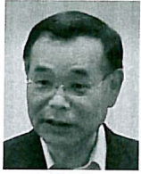
羽生田職業分類委員長