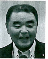
小宮会報雑誌広報委員長