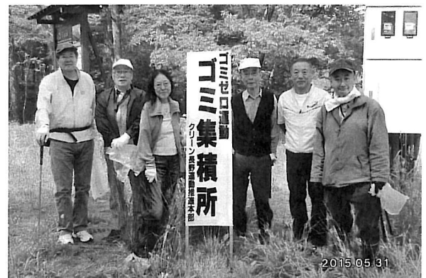
5月30日午前9時前、有志6名参集