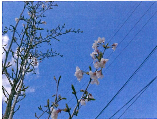
↑まだ少しですが、満開です