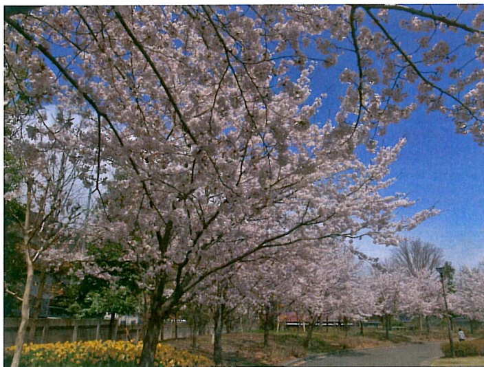
↑同じ公園内のソメイヨシノが満開 早くここまで大きくなってほしいです