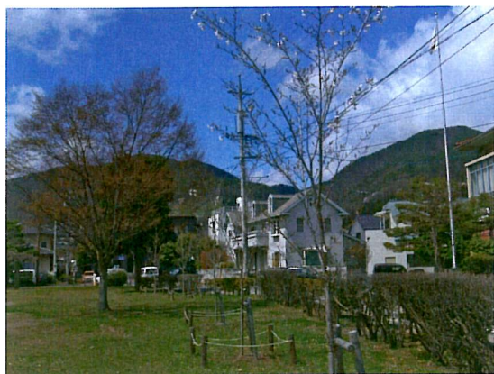
↑初めて植えた桜も大きくなりました