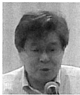
宮本ソングリーダー