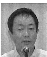
水澤会報雑誌広報委員長