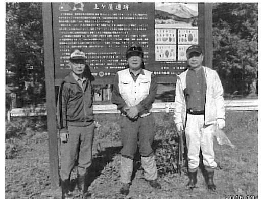
長野りんどうライオンズクラブ メンバー(中央)と会長さん(右)