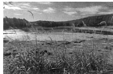
すすきが風によれ 水の引いた池

小一時間で終了。帰り道「祖山」の名物おやきを買って真赤に色づいたリンゴ畑を見ながらループ橋へと下りました。