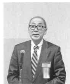
林ガバナー補佐挨拶